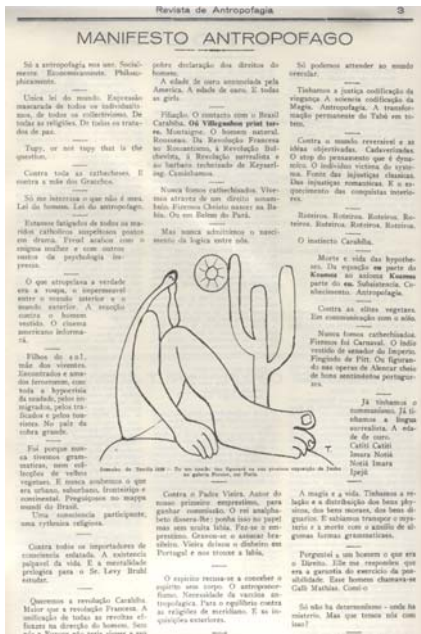
Revista de Antropofagia.- Ano 1 - nº 1 - página 7

"Não fazemos crítica literária. Intriga, sim!" - Freuderico - pseudônimo de Oswald de Andrade.