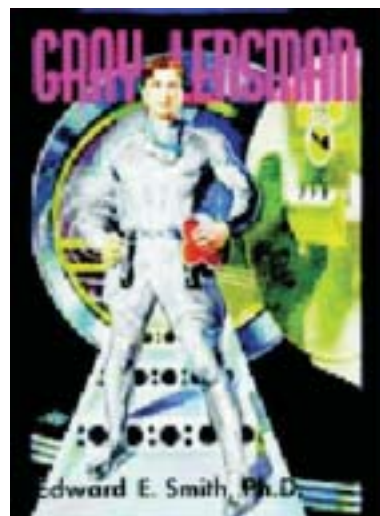
Imagens 1 e 2 – Tela do jogo Spacewar e sua fonte de inspiração